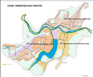
СХЕМА ПЛАНИРОВОЧНЫХ РАЙОНОВ